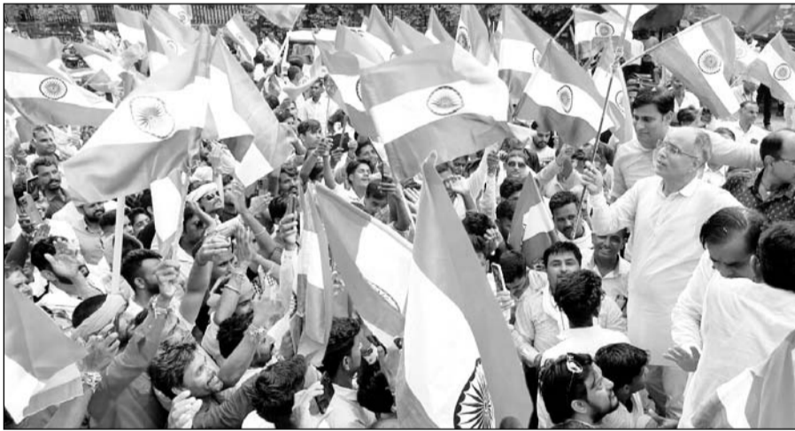
टोडारायसिंह में 1100 से अधिक दुपहिया वाहनों के साथ तिरंगा रैली निकाली गई।

201 फीट का तिरंगा रहा मुख्य आकर्षण का केन्द्र