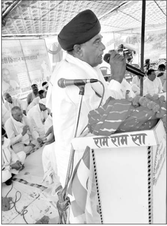
प्रदेशाध्यक्ष रामनिवास मीना ने किसानों को संबोधित किया।

प्रदेशाध्यक्ष मीना ने कहा कि अब इसी कड़ी में आंदोलन को गति देते हुए उत्तरी-पूर्वी राजस्थान के 13 जिलों के सांसदों का घेराव किया जाएगा। उन्होंने कहा कि 20 सितंबर को क्षेत्र के किसान सांसदों के घरों पर जाकर विमर्शपूर्ण निवेदन करेंगे कि ईआरसीपी को राष्ट्रीय परियोजना घोषित करके अपने दायित्व को निभाएं। मीना ने यह भी कहा कि जनसमर्जन जुटाने के लिए संघर्ष समिति की ओर से हस्ताक्षर अभियान भी शुरू किया जा रहा है। 13 जिलों के प्रत्येक विधानसभा क्षेत्र से 2 लाख हस्ताक्षर करके प्रधानमंत्री को प्रस्तुत किए जाएंगे।