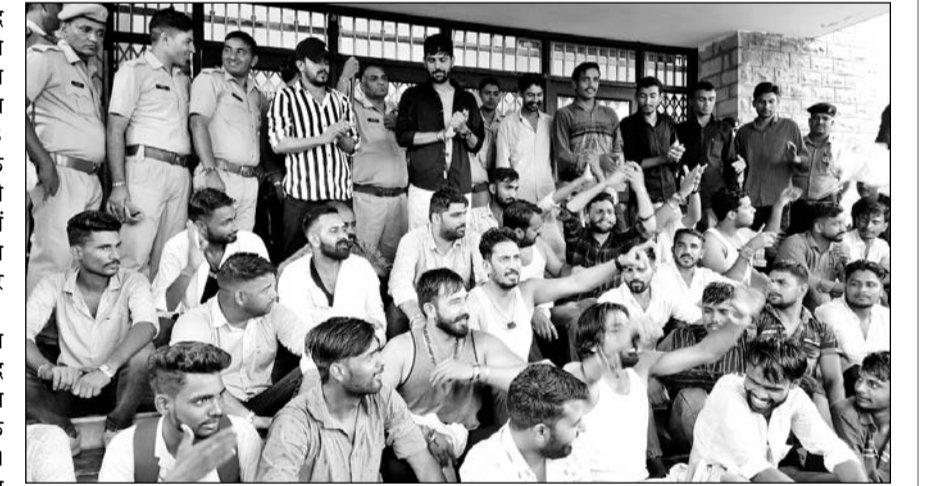
छात्र नेताओं ने पुलिस की मौजूदगी में अर्धनग्न प्रदर्शन किया।