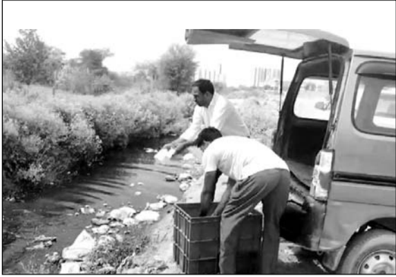
खाद्य सुरक्षा टीम ने जब्त 250 किलो संदिग्ध पनीर को नष्ट कराया।