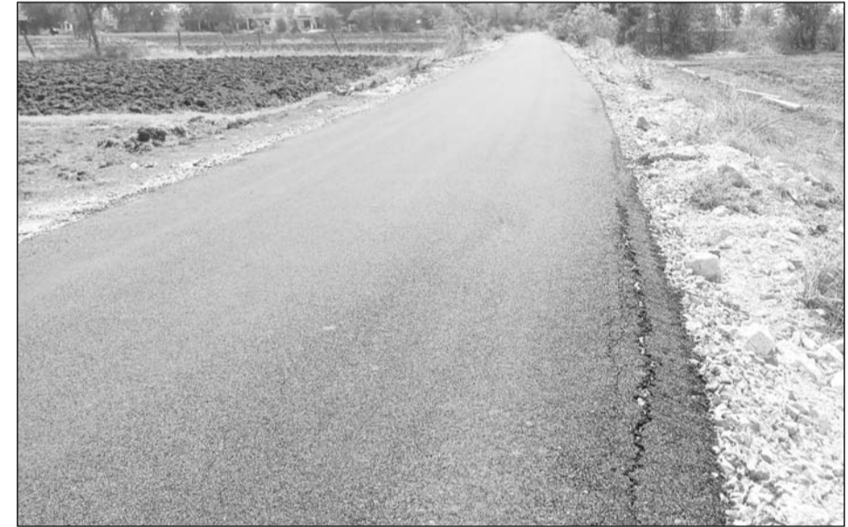
सालेड़ा से लक्ष्मीपुरा गांव जाने वाली बनी हुई सड़क कई जगह पर किनारों के पास से धंस गई है।

लंबे समय से मांग की जा रही थी बताया कि सड़क निर्माण में विभाग ने करीब 1 करोड़ 10 लाख रुपए खर्च किए हैं। नई सड़क पर पैच वर्क करना सड़क निर्माण की गुणवत्ता पर सवाल के साथ ही विभाग व संबंधित ठेकेदार की मिलीभगत के आरोप लग रहे हैं। इसी तरह बीते कुछ समय पहले निकट ग्राम पंचायत अकोला क्षेत्र में करोड़ों की लागत से बनी सड़कें भी समयावधि से पूर्ण हो बदल रही हैं वहीं लोक शिक्षागत के आरंभ में भी विभाग के जिम्मेदार अधिकारियों ने ठेकेदार के