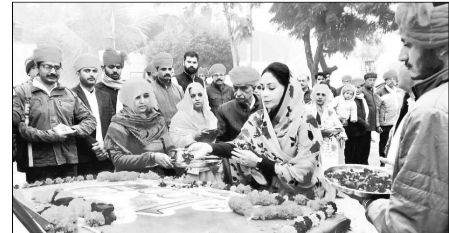
उप मुख्यमंत्री दीया कुमारी ने गुरुवार को श्री क्षत्रिय युवक संघ के संस्थापक तनसिंह की जन्म शताब्दी संदेश यात्रा को झोटवाड़ा स्थित संघ शक्ति कार्यालय से तिलक लगाकर रवाना किया।

जयपुर, (का.सं.)। उप मुख्यमंत्री दीया कुमारी ने गुरुवार को श्री क्षत्रिय युवक संघ के संस्थापक तनसिंह की जन्म शताब्दी संदेश यात्रा को झोटवाड़ा स्थित संघ शक्ति कार्यालय, जयपुर से तिलक लगाकर रवाना किया। यह समारोह 28 जनवरी को जवाहर लाल नेहरू