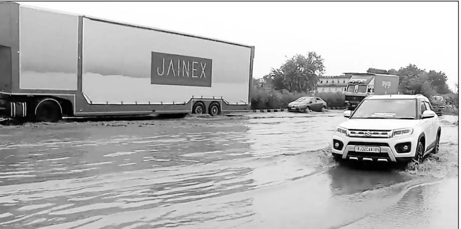
राष्ट्रीय राजमार्ग 48 पर बारिश मे भरा पानी।

पावटा, (नि.सं)। राष्ट्रीय राजमार्ग 48 पर बरसात के पानी के भराव व उसकी निकासी नहीं होना एनएचआई अधिकारियों व प्रशासन की लापरवाही का नतीजा है। पावटा में बावडी मोड़ के पास मुख्य राष्ट्रीय राजमार्ग 48 पर बरसात का पानी जमा होने से राहगीरों, यात्रियों को भारी परेशानियों का सामना करना पड़ रहा है। प्राप्त जानकारी के अनुसार राष्ट्रीय राजमार्ग 48 पानी निकासी के लिए नाला तो बनवा दिया