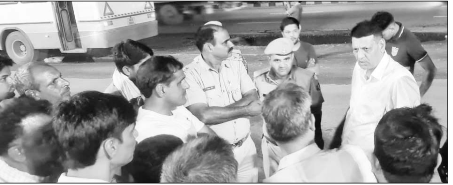
पुलिस ने मौके पर पहुंच मामले की जांच की।

पावटा, (नि.सं)। हरियाणा रोडवेज की बस में बैठे लोग तब सहम गए, जब अचानक उन पर दो गाड़ियों में सवार लोगों ने हवाई फायरिंग व पथराव शुरू कर दिया। दरअसल ओल्ड राव होटल के पास जयपुर से नारनौल जा रही हरियाणा रोडवेज की बस पर फाँचुनर व हेरियर गाड़ी में आए बदमाशों ने हवाई फायरिंग व पथराव कर दिया और मौके से फरार हो गए। फिलहाल भाबर, प्राणपुरा पुलिस मामले की जांच कर रही है कि आखिर बस पर हवाई फायरिंग व पथराव क्यों किया गया था। घटना गुरुवार रात करीब