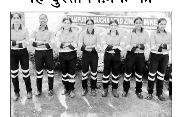
रामपुरा आगुचा माइंस में महिला टीम ने पूर्ण प्रशिक्षण किया

भीलवाड़ा, (निर्स)। हिन्दुस्तान जिंक की राजपुरा दरीबा माइंस के देश के पहली महिला रेस्क्यू टीम का गौरव हासिल करने बाद रामपुरा आगुचा माइंस में महिला रेस्क्यू टीम ने अपना प्रशिक्षण पूर्ण कर देश में दूसरी महिला माइंस रेस्क्यू टीम की उपलब्धी प्राप्त की है। रामपुरा आगुचा खदान का सुरक्षा में समावेशित और उत्कृष्टता की दिशा में एक महत्वपूर्ण कदम है। माइनें रेस्क्यूएनस्टेशन, वेस्टर्न कोल फील्ड लिमिटेड, नागपुरा के विशेषज्ञ मार्गदर्शन एवं खान सुरक्षा महानिदेशालय के निदेशों के अनुपालन में, रामपुरा आगुचा खदान की महिला इंजीनियर ने 18 दिनों का गहन प्रशिक्षण कार्यक्रम पूर्ण किया।