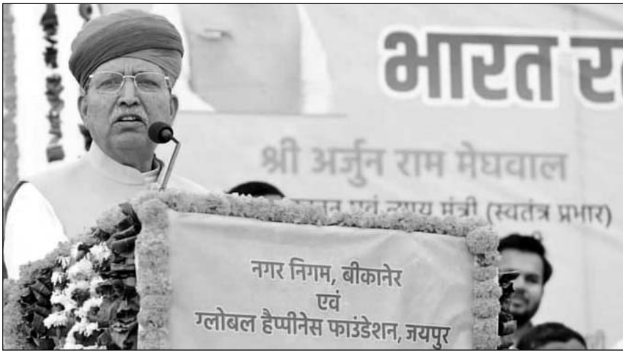
भारत रत्न डॉ. बाबा साहेब अम्बेडकर ऑडिटोरियम और लाइब्रेरी भवन के शिलान्यास समारोह को केन्द्रीय विधि एवं न्यायमंत्री अर्जुनराम मेघवाल ने संबोधित किया।

बीकानेर, (कास)। बाबा साहेब अम्बेडकर ऑडिटोरियम और लाइब्रेरी के नए भवन का शिलान्यास कार्यक्रम शुक्रवार को खाटूरिया कॉलोनी में आयोजित किया गया। नगर निगम और ग्लोबल हैपीनेस फाउंडेशन जयपुर द्वारा आयोजित कार्यक्रम के मुख्य अतिथि केन्द्रीय विधि एवं न्याय मंत्री अर्जुनराम मेघवाल थे। उन्होंने कहा कि बाबा साहेब ने 'पे बैक टू द सोसायटी' का सिद्धांत दिया। आज के दौर में यह अत्यंत प्रासंगिक है। इसे ध्यान रखते हुए सोशल कॉरपोरेट रिस्पॉन्सिबिलिटी के तहत बीकानेर को अत्यधिक पुस्तकालय, ऑडिटोरियम और एम्प्ली थियेटर की सौगात दी गई है। उन्होंने कहा कि यह केन्द्र बीकानेर शहर के नॉलेज सेंटर के रूप में विकसित होगा। यहां पढ़ने वाले बच्चे आने वाले समय में देश और दुनिया में बीकानेर का नाम रोशन करेंगे।