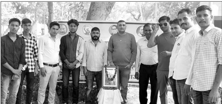
बीकानेर के गांधी पार्क में अखिल आदिवासी मीणा महासभा द्वारा बिरसा मुंडा की जयंती पर उन्हें श्रद्धांजलि दी।

बीकानेर, (कास)। अखिल आदिवासी मीणा महासभा द्वारा गांधी पार्क में आयोजित दीपावली स्नेह मिलन समारोह व बिरसा मुंडा की 150 वीं जयंती धूमधाम से मनाई गई। आज हमारी युवा पीढ़ी को बिरसा मुंडा के जीवन से प्रेरणा लेकर राष्ट्र सर्वोपरि की परिकल्पना के साथ रोजगारमुखी शिक्षा को अपनाकर भारत को विश्वगुरु बनाने में अपना महत्वपूर्ण योगदान देना चाहिए। हम इस मां भारती के असली पुत्र हैं। भारत पुत्र, धरती पुत्र आदिवासी जनजाति हैं और भारत का हर नागरिक आदिवासी है। हमें आपस में लड़ने लड़ाने वाले लोगों के मंसूबे कामयाब नहीं होने देंगे। इस तरह के आयोजन समाज में नई मिसाल कायम करेगा। उक्त उद्गार बिरसा मुंडा की जयंती पर आयोजित संगीष्ठी व दीपावली स्नेह मिलन समारोह में शिक्षाविद् एवं अखिल