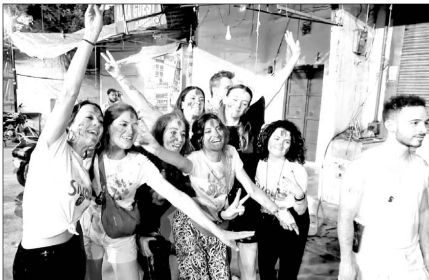
पुष्कर आये देशी-विदेशी पर्यटकों ने जमकर होली खेली।