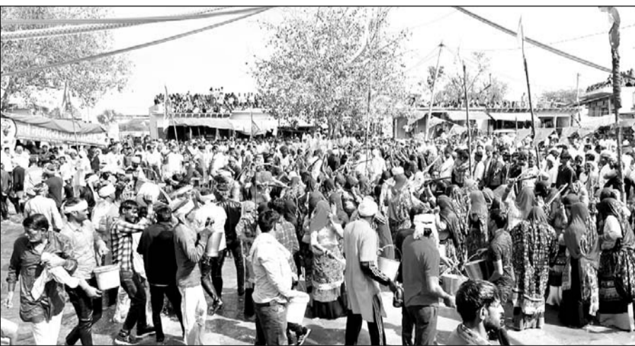
जगदीश धाम कैमरी के मंदिर प्रांगण में स्थित जगदीश चौक में डोलची होली खेलेली गई।

गुर्जर जाति के बारह गांव खटाना गौर की ओर से सैकड़ों वर्षों से चली आ रही यह होली पुरानी परंपरा व संस्कृति को जीवंत किये हुए है। जगदीश चौक में बैड-बाजे की धुन पर 12 गांवों के महिला व पुरुषों (देवर-भाभी) ने हर्षोल्लास के साथ डोलची में रंग भरकर रिश्ते में अपनी भाभी लगने वाली महिलाओं पर रंग बरसाया। महिलाओं ने पुरुषों पर कोड़े बरसाए। रंगों की बौछार से माहौल सतरंगी हो गया। डोलची होली देखने के लिए 12 गांव खटाना परिवार सहित बड़ी संख्या में गुर्जर समाज सहित करौली, दौरा, सवाई माधोपुर, भरतपुर सहित अन्य जिलों के हजारों लोग पहुंचे। डोलची होली की शुरुआत दोपहर को कैमरी को बसाने वाले सुडा बाबा के स्थान पर बारह गांवों के पंच-पटेलों ने विशेष पूजा-अर्चना की।