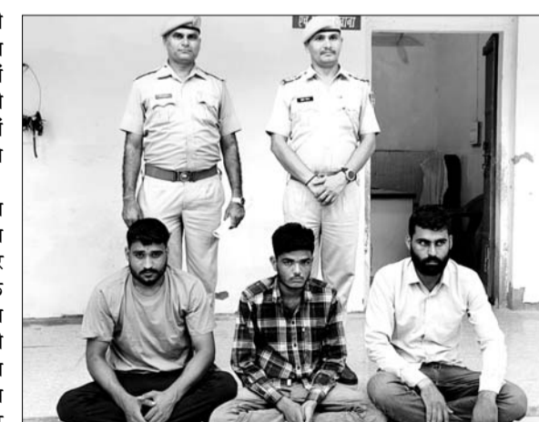
पुलिस ने हनीट्रेप मामले में तीन आरोपियों को गिरफ्तार किया।