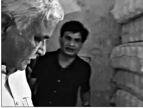
कृषि मंत्री डॉ. किरोड़ीलाल मीणा ने गुरुवार को कानोता क्षेत्र स्थित हीरावाला रीको औद्योगिक क्षेत्र में संचालित 'जयपुर बायो फर्टिलाइजर्स' इकाई पर औचक निरीक्षण कर कार्रवाई की।

-कार्यालय संवाददाता- जयपुर। प्रदेश में नकली खाद और बीज के कारोबार के खिलाफ चलाए जा रहे विशेष अभियान के तहत कृषि मंत्री डॉ. किरोड़ीलाल मीणा ने गुरुवार को जयपुर के कानोता क्षेत्र स्थित हीरावाला रीको औद्योगिक क्षेत्र में संचालित 'जयपुर बायो फर्टिलाइजर्स' इकाई पर औचक निरीक्षण कर बड़ी कार्रवाई की। मंत्री के आचानक पहुंचने