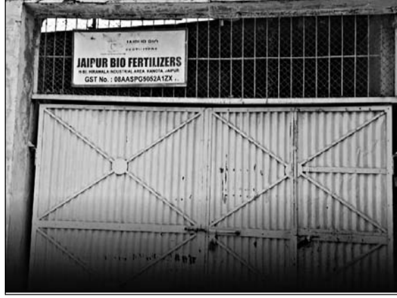
कृषि मंत्री डॉ. किरोड़ीलाल मीणा ने गुरुवार को कानोता क्षेत्र स्थित हीरावाला रीको औद्योगिक क्षेत्र में संचालित 'जयपुर बायो फर्टिलाइजर्स' इकाई पर औचक निरीक्षण कर कार्रवाई की।

■ मंत्री किरोड़ीलाल ने दोषियों पर सख्त कार्रवाई की चेतावनी दी