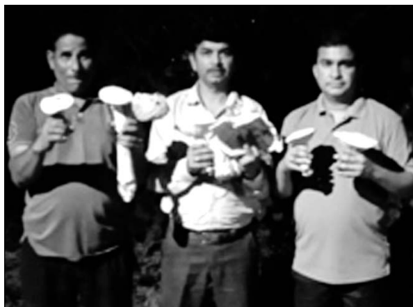
खाद्य दूध छाता मशरूम (केलोसाइबे इंडिका) की नई जंगली प्रजाति की खोज करने वाली टीम।

उदयपुर, (कास)। भारतीय कृषि अनुसंधान प्रकल्प ने दिल्ली के मशरूम अनुसंधान निदेशालय चम्बाघाट के वडा सोलन (हिमाचल प्रदेश) के द्वारा संचालित अखिल भारतीय सर्वांगीण मशरूम अनुसंधान परियोजना, उदयपुर के वैज्ञानिकों ने राजस्थान के विभिन्न वन्य जीव अभ्यारण्यों एवं जंगलों में खाद्य एवं औषधीय मशरूम की विविधता का अध्ययन करने के लिए माह जुलाई-अगस्त में सघन निरीक्षण किया। निरीक्षण के दौरान अभी तक कुल 64 मशरूम प्रजातियों का संग्रहण किया है। निरीक्षण प्रमुख रूप से फुलवारी की नाल, फलासिया-कोटड़ा की नाल, सीतामाता वन्य जीव अभ्यारण्य-प्रतापगढ़, गोगुन्दा, सांडोल माता झंडोलाव झल्लारा, सल्लुवर के जंगलों का किया गया। अखिल भारतीय समन्वित मशरूम अनुसंधान परियोजना