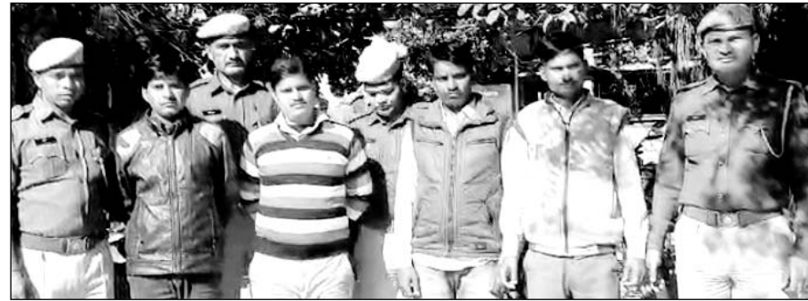
हत्या के दर्ज प्रकरण में आजीवन कारावास के आरोपी।