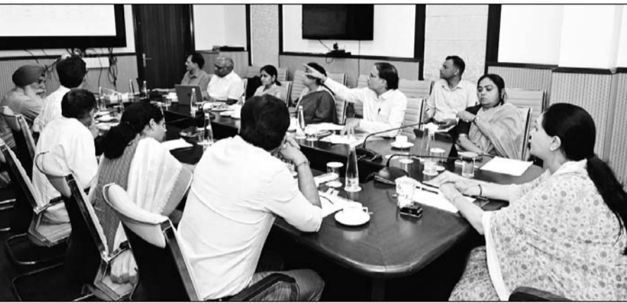
उपमुख्यमंत्री तथा महिला एवं बाल विकास मंत्री दिया कुमारी की अध्यक्षता में मंगलवार को सचिवालय में विभागीय योजनाओं एवं कार्यक्रमों की समीक्षा बैठक हुई।