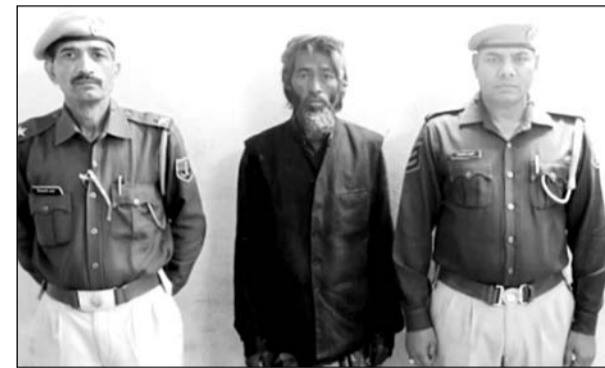
पुलिस गिरफ्त में बांग्लादेशी नागरिक।