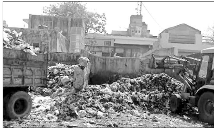
अजमेर के गंज क्षेत्र के मुख्य मार्ग पर लगा गंदगी का ढेर।

अजमेर नगर निगम व अजमेर विकास प्राधिकरण की पंचशील, हरिभाऊ उपाध्याय नगर, कोटड़ा