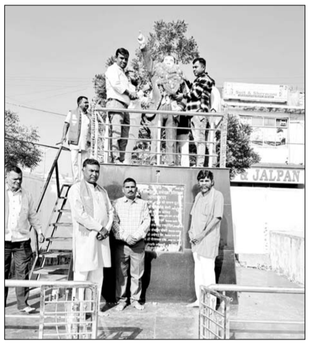
जालोर में डॉ. भीमराव अम्बेडकर को श्रद्धांजलि दी।

कहा कि यह पहल न केवल स्वच्छता का भावना को बढ़ावा देती है, बल्कि समाज में जागरूकता का भी संदेश देती है। संविधान दिवस पर इस तरह के प्रयास दिखाते हैं कि स्वच्छ भारत मिशन का सपना केवल सरकार का नहीं, बल्कि हर नागरिक का है। अंबेडकर सेवा समिति और