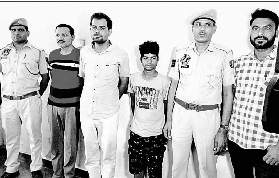
बजाज नगर पुलिस ने व्यवसायी के घर में नकदी-जेवर चुराने वाले ड्राईवर व नौकर समेत तीन बदमाशों को गिरफ्तार किया।