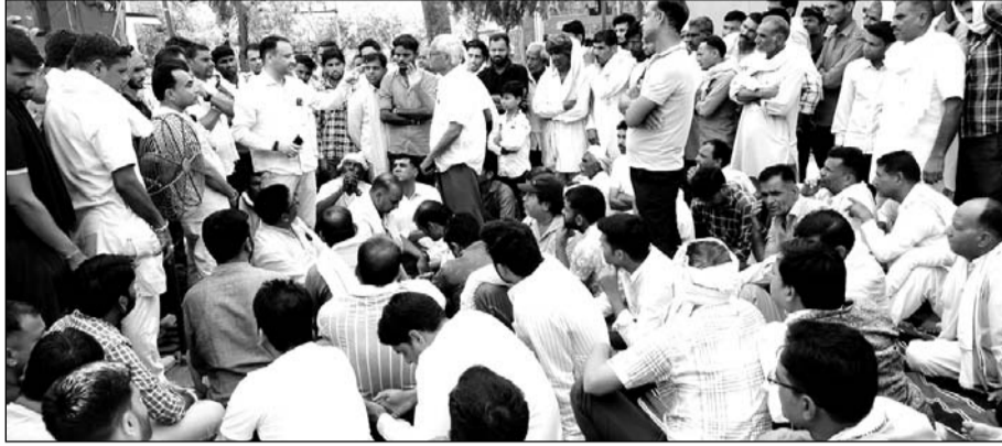
मंडी में चोरी की वारदातों तथा प्रशासन की लापरवाही के विरोध में व्यापारियों ने मुख्य गेट पर ताला लगा कर प्रदर्शन किया।

मालपुरा, (निर्स)। ए श्रेणी की मालपुरा कृषि मंडी में लगे दो दर्जन सीसीटीवी कैमरे बंद होने के साथ-साथ मंडी परिसर में पर्याप्त रोशनी तथा चौकीदार के अभाव में आये दिन हो रही चोरी की वारदातों पर अंकुश लगाने तथा किसान व व्यापारियों को सुरक्षा व सुविधा मुहैया करवाने में कोलाही बरत रहे मंडी प्रशासन के विरुद्ध व्यापारियों ने गुरुवार को अपने प्रतिष्ठान बंद रख मंडी गेट पर ताला लगा कर धरने पर बैठ गये।