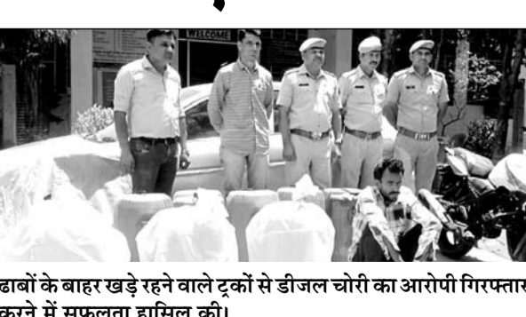
ढाबों के बाहर खड़े रहने वाले ट्रकों से डीजल चोरी का आरोपी गिरफ्तार करने में सफलता हासिल की।