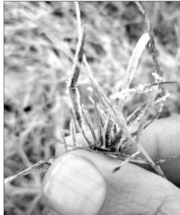
उदयपुर में तेज सर्दी से फसलों पर जमी बर्फ की परत।

रविवार को यह तापमान (-0.5) डिग्री रिकॉर्ड किया गया। सर्दी बढ़ने व छुट्टी का दिन होने से शहर के बाजारों