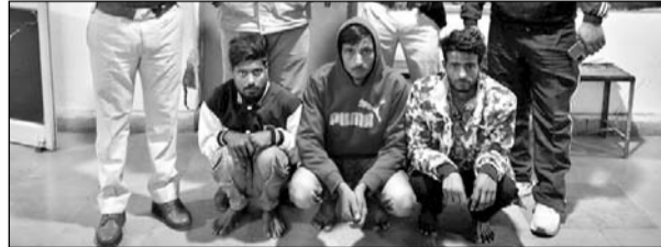
जानलेवा हमले के फरार आरोपियों को पुलिस ने गिरफ्तार किया।