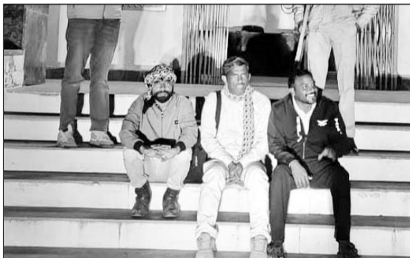
पुलिस ने नगद राशि सहित तीन जनों को गिरफ्तार किया।