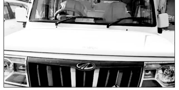
जयपुर की टीम ने तम्बाकू, सुपारी थोक विक्रेता के यहां छापामारी कार्रवाई की

हिण्डौन सिटी (कासं)। शहर में जीएसटी विभाग, जयपुर की टीम ने बुधवार को एक शहर के एक तम्बाकू, सुपारी उत्पाद के थोक विक्रेता कारोबार के प्रतिष्ठान पर छापामारी कार्रवाई की। विभाग की टीम ने सुबह 7 बजे से चली कार्रवाई में टीम के सदस्यों ने बयाना रोड स्थित टीकम कटरा स्थित