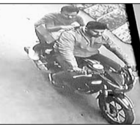
सीसी फुटेज में बाइक पर सवार दो संदिग्ध युवक।