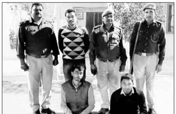
पुलिस ने आरोपियों को गिरफ्तार किया।