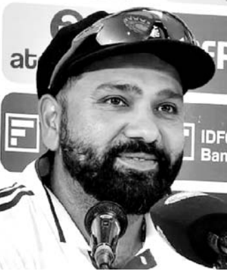
बतौर कप्तान भेजने का फैसला किया है। बोर्ड का कहना है कि रोहित ने साबित कर दिया है कि वह क्या कर सकते हैं। हर किसी

नई दिल्ली, 15 मार्च। रोहित शर्मा की अगुवाई में भारत ने हाल ही में चैंपियंस ट्रॉफी 2025 जीती। जिस कारण उनकी टेस्ट कप्तानी को भी जीवनदान मिला है। बताया जा रहा है कि जून से आगस्त के बीच इंग्लैंड के खिलाफ पांच टेस्ट मैचों की सीरीज में रोहित शर्मा ही कप्तान होंगे। ऑस्ट्रेलिया दौर पर टेस्ट सीरीज में भारत का प्रदर्शन काफी खराब था। इसके बाद रोहित शर्मा को कप्तानी पर सवाल उठने लगे थे। यहां तक कि आखिरी टेस्ट में रोहित ने खुद को टीम से बाहर कर लिया था। इस टेस्ट में जसप्रीत बुमराह ने भारत की कप्तान संभाली थी। अब चैंपियंस ट्रॉफी में जीत के बाद रोहित को बीसीसीआई का पूरा समर्थन मिला है। इंडियन एक्सप्रेस के मुताबिक बोर्ड और चयनकर्ता रोहित को एक और बड़े दूर पर