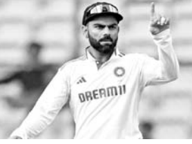
खेल इस परिस्थितिकी तंत्र में महत्वपूर्ण भूमिका निभाते हैं। किसी भी देश में खेल के सुधार के लिए पुरुषों को देखते हुए यह सामूहिक होना चाहिए। खेल संस्कृति में सभी शामिल हैं, और महिला खेल इसका एक बड़ा हिस्सा है।

बेंगलुरु, 15 मार्च। पूर्व भारतीय कप्तान विराट कोहली ने शनिवार को देश में महिला खेलों के परिवर्तन के पीछे महिला खिलाड़ियों की भूमिका को सराहना करते हुये कहा कि उनके खुद के प्रयासों से वाणिज्यिक विकास, वित्त पोषण में वृद्धि हुई और आखिरकार महिला प्रीमियर लीग (डब्ल्यूपीएल) अस्तित्व में आया। लीडर्स द्वारा संचालित आरसीबी इनोवेशन लैब इंडियन स्पोर्ट्स समिट में बोलते हुए कोहली ने महिला खेलों के बदलते परिदृश्य पर कहा, महिला एथलीटों ने खुद पर ध्यान आकर्षित किया, जिससे वाणिज्यिक विकास हुआ, वित्त पोषण में वृद्धि हुई और अंततः डब्ल्यूपीएल का निर्माण हुआ। कोहली ने खेल विकास के लिए सामूहिक दृष्टिकोण की आवश्यकता पर जोर दिया, उन्होंने कहा कि महिला