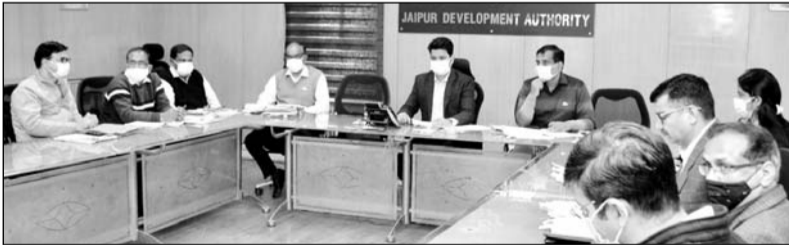
जेडीए पट्टे देने का काम करेगा। राज्य सरकार ने कोविड ना ही वहां 90ए-90बी जैसी कोई कार्रवाई हुई है। वहां पर अब जेडीए प्रशासन कैंप लगाकर लोगों को