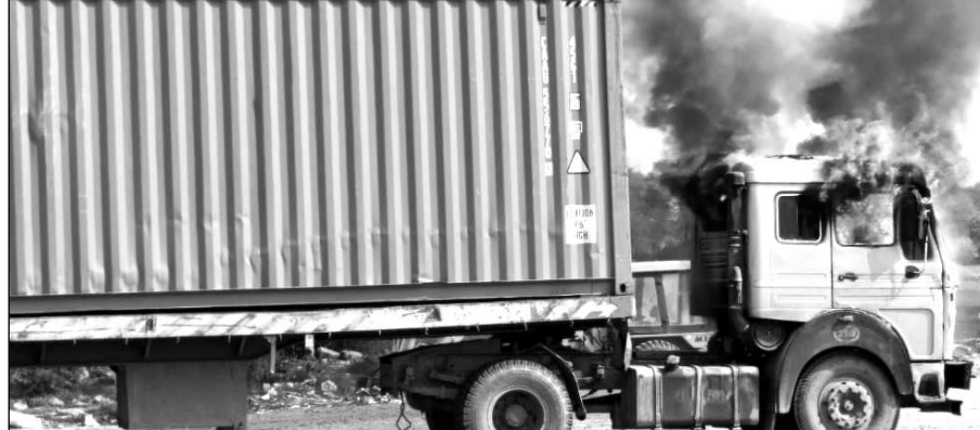
आग लगने के कारण ट्रेलर धूँ-धूँ कर जलने लगा।

चौमू/कालाडैरा, (निसं)। मंगलवार दोपहर को एनएच-52 पर स्थित टांटीयावास टोल प्लाजा के पास एक ट्रेलर के केबीन में अचानक आग लग गई। लगते ही ट्रेलर के ड्राइवर व खलासी ने कुदकर अपनी जान बचाई, आग लगने के कारण ट्रेलर धूँ-धूँ कर