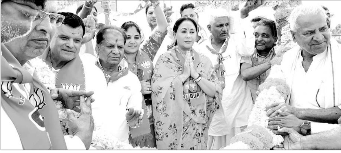
भाजपा प्रत्याशी डॉ. ज्योति मिर्धा के पक्ष में आयोजित जन सभाओं में उपमुख्यमंत्री दिया कुमारी का स्वागत किया।

मकराना क्षेत्र के विश्नोई और राजपूत समाज ने ज्योति मिर्धा को समर्थन देने का एलान किया