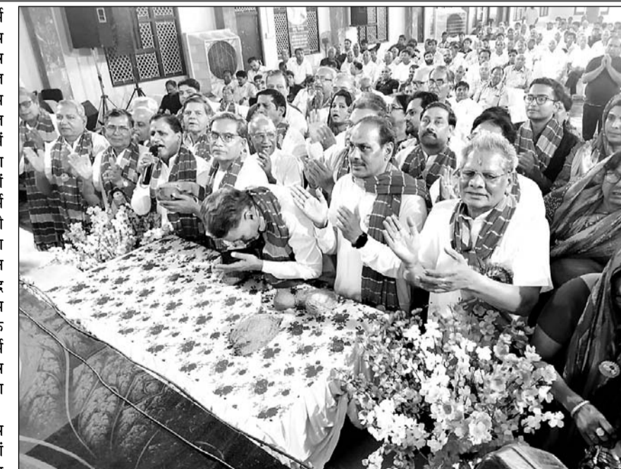
अखिल भारतवर्षीय धर्म जागृति संस्थान का सप्तम राष्ट्रीय अधिवेशन संपन्न हुआ।

पूरे देश से पधारे करीब सात सौ प्रतिनिधियों की उपस्थिति में आयोजित हुआ कार्यक्रम