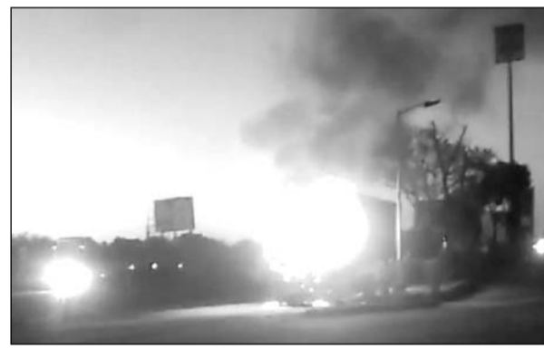
दिल्ली-अजमेर हाइवे पर बिलौची के पास कंटेनर में आग लग गई।

जयपुर से दिल्ली की तरफ जा रहा था कि देर रात होने व नींद आने से