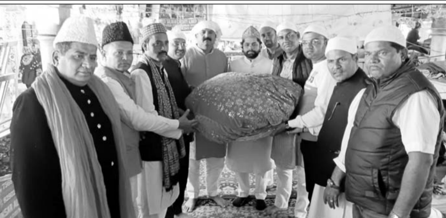
ख्वाजा मोइनुद्दीन हसन चिश्ती के उर्स के मौके पर वसुंधरा राजे की ओर से भेजी गई चादर पेश की।