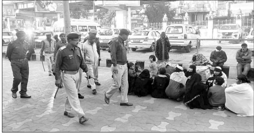
उत्तर-पश्चिम रेलवे सुरक्षा बल अजमेर मंडल द्वारा रेलवे स्टेशन अजमेर की सुरक्षा व्यवस्था के माकूल इंतजाम किये गये हैं।

अजमेर, (कास)। उत्तर-पश्चिम रेलवे सुरक्षा बल अजमेर मंडल द्वारा ख्वाजा मोइनुद्दीन हसन चिश्ती की दरगाह के 813वें उर्स के मद्देनजर रेलवे स्टेशन अजमेर की सुरक्षा व्यवस्था के माकूल इंतजाम किये गये हैं। रेलवे स्टेशन पर रेलवे सुरक्षा बल थाना अजमेर द्वारा 260 अधिकारी, स्टाफ को तैनाती की गई है। पूरे अजमेर स्टेशन पर निगरानी के लिए 123 सीसीटीवी कैमरे स्थापित हैं तथा दौरा एवं मदार स्टेशनों पर भी 15-15 कैमरे स्थापित किये गये हैं, जिससे संदिग्ध व्यक्तियों की गतिविधियों पर सूक्ष्म निगरानी की जा रही है।