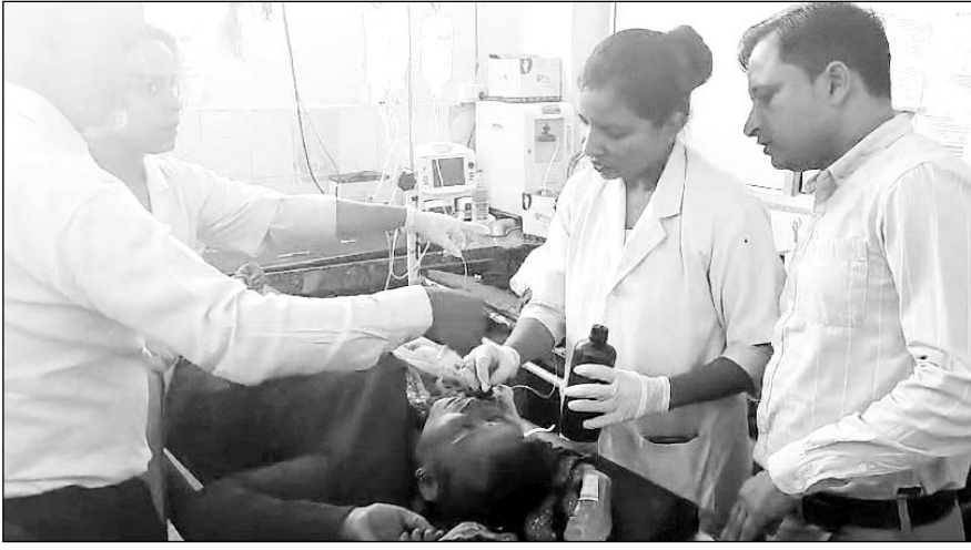
घायल महिलाओं को उपचार के लिए अस्पताल में भर्ती कराया।