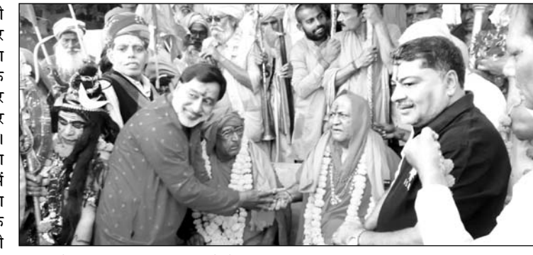
पुष्कर के सप्तऋषि घाट पर संतों ने शाही स्नान किया।

अजमेर/पुष्कर, (कासं)। तीर्थ नगरी पुष्कर में चले रहे अंतर्राष्ट्रीय पुष्कर मेले में गुरुवार को ब्रह्म चौदस पर देश भर से आए साधु संतों ने सरोवर के सप्त ऋषि घाट पर शाही स्नान कर सम्पूर्ण मानव जाति के कल्याण और देश में खुशहाली की मनोकामना की। कार्तिक पूर्णिमा के पदम् योग के संयोग में शुक्रवार को पुष्कर सरोवर में महास्नान के साथ धार्मिक मेले का सामपन होगा। पूर्णिमा महास्नान के लिए श्रद्धालुओं का रेला गुरुवार की दोपहर बाद से उमड़ने लग गया। देर शाम तक लाखों श्रद्धालु पुष्कर पहुंच गए और उनके आने का सिलसिला जारी है। शुक्रवार अलसुबह ब्रह्म मुहूर्त में पूर्णिमा पर सरोवर में महास्नान होगा जो पूरे दिन भर चलेगा।