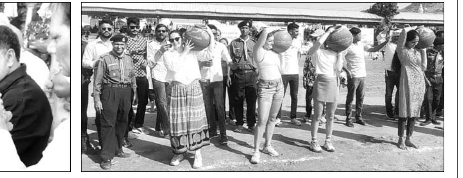
मेला मैदान में खेलकूद प्रतियोगिताओं में देशी-विदेशी पर्यटकों ने दमखम दिखाया।