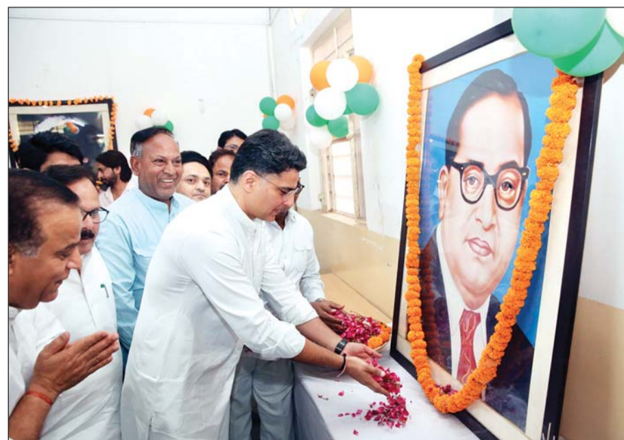
कांग्रेस के राष्ट्रीय महासचिव एवं पूर्व उपमुख्यमंत्री सचिन पायलट ने मंगलवार को प्रदेश कांग्रेस मुख्यालय में बाबा साहेब की जयंती पर आयोजित पुष्पांजलि कार्यक्रम में शामिल हुए।

और जनगणना जैसे मुद्दों पर पारदर्शिता बनाए रखने के लिए सर्वदलीय बैठक बुलाई जानी चाहिए।