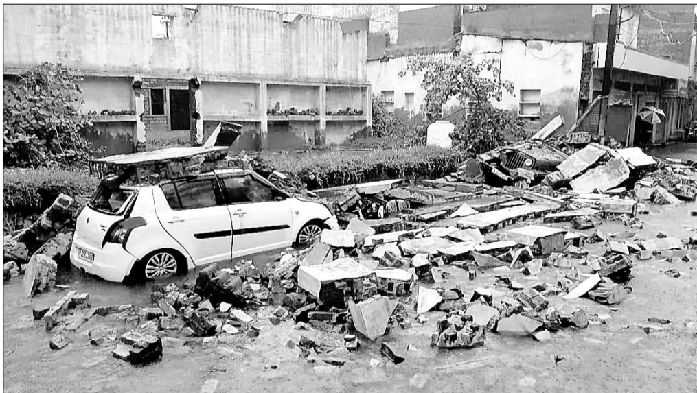
पाली शहर में जंगी बड़ा के निकट फैक्ट्री की कच्ची दीवार गिरने से कई वाहन दब गए।

जिससे पाली के हेमावास बांध में भी पानी आना शुरू हो गया। जिले में कई जगह पर सैकड़ों पेड़ व विद्युत पोल गिर गए जिससे पाली शहर में भी 18 घंटे लाइट बंद रही। रविवार शाम 6 बजे विद्युत सप्लाई की गई। पाली शहर में जंगी बड़ा के निकट एक फैक्ट्री की कच्ची दीवार गिरने से एक कार व हार पांच वाहन क्षतिग्रस्त हो गए। शहर के नगर