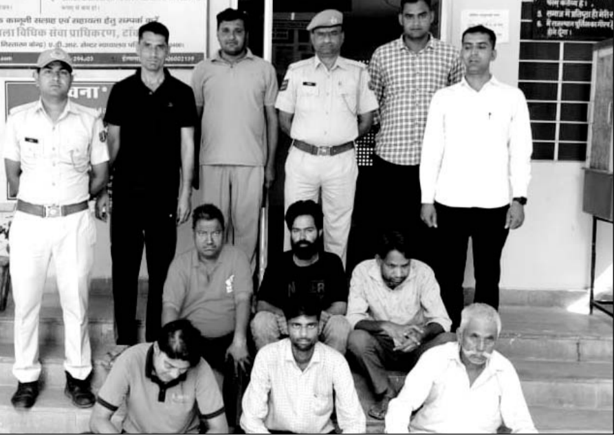
तीन स्थानीय वारंटी व 4 गिरफ्तारी वारंटियों को अलग-अलग जगह से गिरफ्तार किया।