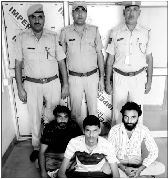
हरियाणा सीमा के पास गांव खैरू बड़ी चौराहे पर जानलेवा हमला करने के मामले में फरार 3 आरोपियों गिरफ्तार किया।

सादुलपुर, (निसं)। हरियाणा सीमा के निकट तहसील के गांव खैरू बड़ी चौराहे पर जीप को जीप से टक्कर मारने तथा लोहे की रॉड से ताबड़तोड़ जानलेवा हमला करने के मामले में फरार तीन आरोपियों को हमीरवास पुलिस ने गिरफ्तार किया है। पुलिस ने घटना 14 दिनों बाद फरार तीन आरोपियों को दबोचने में सफलता प्राप्त की है।