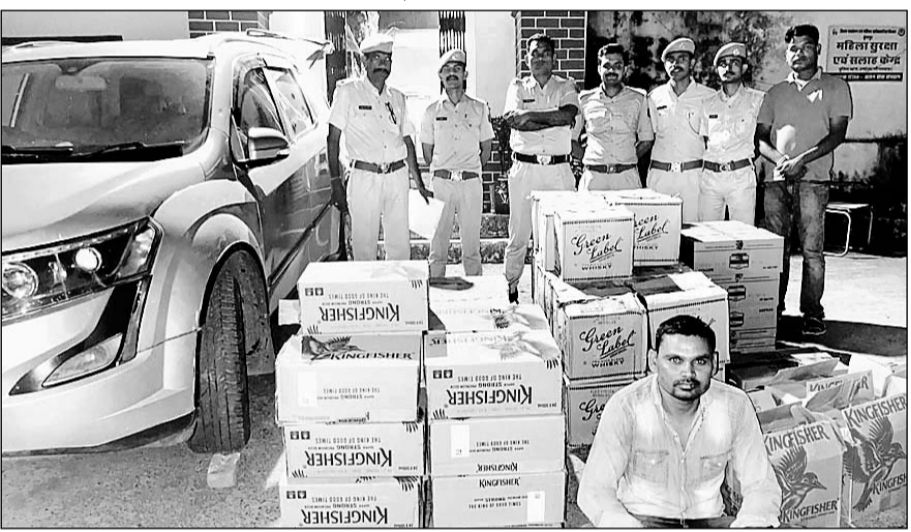
धंबोला पुलिस ने गुजरात के पुनावाडा चेक पोस्ट पर एक लगजरी कार से 5 लाख की अवैध शराब पकड़ी।

डूंगरपुर। धंबोला थाना पुलिस ने गुजरात से सटे पुनावाडा चेक पोस्ट पर एक लगजरी कार से 5 लाख की अवैध शराब पकड़ी है। कार ड्राइवर को शराब तस्करी के आरोप में गिरफ्तार कर लिया है। आरोपी शराब की तस्करी कर गुजरात ले जा रहा था। धंबोला थानाधिकारी ने बताया कि चौरासी विधानसभा उपचुनावों की आचार संहिता के तहत अवैध शराब के कारोबार पर सख्ती की जा रही है। गुजरात से सटे बॉर्डर पर गाड़ियों की तलाशी ली जा रही है। इसी दौरान पुनावाडा बॉर्डर पर रविवार रात को गुजरात नंबर की एक लगजरी एसयूवी कार को रूकवाया। कार की तलाशी में अवैध शराब भरी हुई मिली। कार ड्राइवर के पास शराब ले जाने के कोई कागजात भी नहीं था। जिस पर पुलिस ने शराब के साथ कार को जब्त कर लिया। कार से 75 पेट्टी शराब मिली है। जिसकी कीमत करीब 5 लाख रुपए बताई जा रही है। वहीं, शराब तस्करी कर