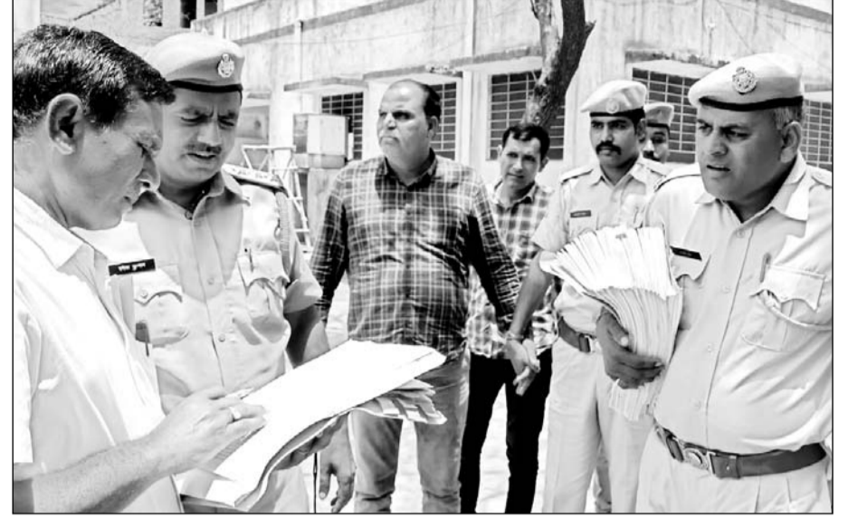
रीट प्रकरण में आरोपी को पेश करने ले जाती एसओजी।

रीट पेपर लीक मामले में 2 और आरोपी जालोर से गिरफ्तार