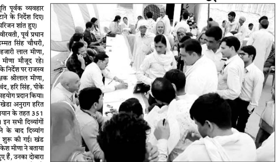
सक्षम अलवर अभियान के तहत शिविर में 351 से अधिक रजिस्ट्रेशन किए गए।