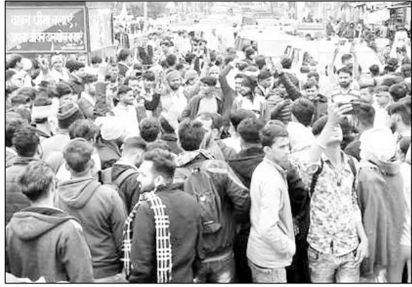
करौली कलेक्ट्रेट सफिकल पर पीड़ित परिवारजनों के साथ लोगों ने धरना देकर जाम लगाया।