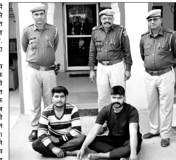
दलित युवक से मारपीट मामले में फरार वांछितों को गिरफ्तार किया।

एनडीपीएस एक्ट का वांछित आरोपी गिरफ्तार : एनडीपीएस एक्ट में वांछित फरार आरोपी को प्रागपुरा