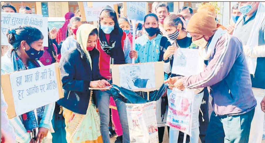
पावटा में भाजपाइयों ने अलवर गैंगरेप मामले में मुख्यमंत्री अशोक गहलोत का पुतला जलाया।