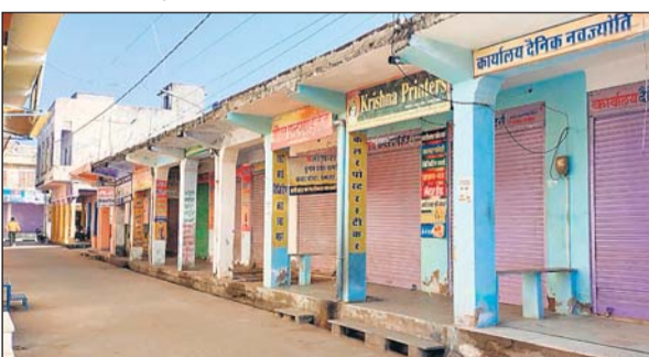
मंगलवार को पूर्णरूप से बंद रहे मालपुरा शहर के बाजार।

कर मंगलवार के साप्ताहिक अवकाश को वीकेंड कर्फ्यू में तब्दील किये जाने के चलते मंगलवार को मालपुरा शहर के बाजार पूर्ण रूप से बंद रहे तो लोग चाय व फल-सब्जी तक के लिए तरसते रहे। मंगलवार को शहर क्षेत्र में एक भी व्यापारी ने अपना प्रालिखन खोलने की जहमत नहीं उठाई। पुलिस व प्रशासन रोजमर्रा की तरह मुस्तैद रहा। बाजारों में