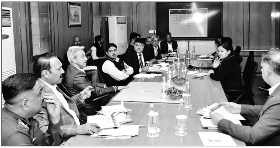
मुख्य सचिव सुधांशु पंत ने मंगलवार को शासन सचिवालय में आयोजित नार्को काॅर्डिनेशन सेन्टर तंत्र की राज्य स्तरीय कमेटी की बैठक की अध्यक्षता की।

पंत मंगलवार को शासन सचिवालय में आयोजित नार्को