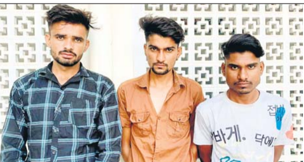
पुलिस ने मादक पदार्थ तस्करी करते तीन युवक पकड़े।