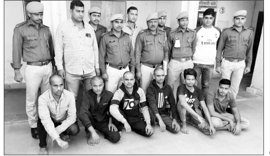
कोटा पुलिस ने लूट की योजना बनाते हुए 6 बदमाशों को गिरफ्तार किया।

बदमाशों पर पहले से 60 से अधिक मामले दर्ज हैं