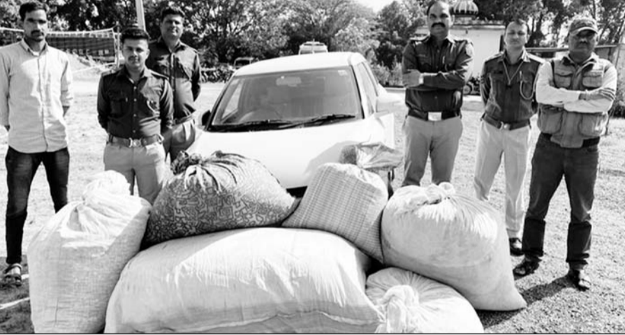
नाकाबंदी तोड़कर भाग रहे तस्करों पर पुलिस ने फायरिंग की।