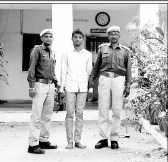
कोतवाली थाना पुलिस की गिरफ्त में आया मोटर साइकिल चोरी करने का आरोपी।