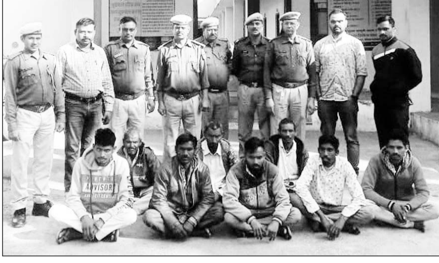
सदर थाना पुलिस द्वारा कांकारी डूंगरी प्रकरण में उपद्रव करने के मामले में गिरफ्तार किए गए आरोपी।

इस मामले में पुलिस ने फरार आरोपियों पर निगरानी रखते हुए भुवाली, मोतली मोड, बिछीवाडा, शामलाजी, खेरवाडा, बावलवाडा तथा केसरीयाजी में इन फरार आरोपियों की दृष्टि देकर डिटेन कर अनुसंधान के बाद गिरफ्तार किया। यह सभी अभियुक्त गिरफ्तारी से बचने के लिए अपने