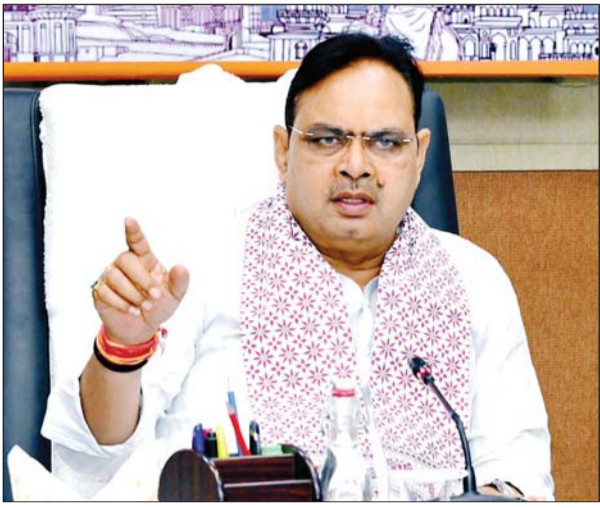
मुख्यमंत्री भजनलाल शर्मा ने जयपुर में प्रस्तावित राजस्थान मण्डपम की कार्ययोजना के संबंध में उच्चस्तरीय बैठक को संबोधित किया।

जयपुर, 17 मार्च। मुख्यमंत्री भजनलाल शर्मा ने कहा कि प्रदेश को 350 बिलियन डॉलर की अर्थव्यवस्था बनाने के लक्ष्य की पूर्ति के लिए राज्य सरकार औद्योगिक, पर्यटन एवं सांस्कृतिक गतिविधियों के प्रोत्साहन के लिए कृतसंकल्पित होकर कार्य कर रही है। उन्होंने कहा कि राजस्थान मंडपम के माध्यम से व्यापारिक एवं सांस्कृतिक कार्यक्रमों के लिए विश्वस्तरीय सुविधाएं उपलब्ध करवायी जाएंगी, ताकि प्रदेश बड़े-बड़े आयोजनों के लिए पहली पसंद बने और यहां कॉन्फ्रेंस टूरिज्म को बढ़ावा मिल सके। शर्मा ने सोमवार को मुख्यमंत्री निवास पर जयपुर में प्रस्तावित राजस्थान मण्डपम की कार्ययोजना के संबंध में उच्चस्तरीय बैठक को संबोधित किया। उन्होंने कहा कि राजस्थान मंडपम में होलिस्टिक अप्रोच के साथ आवश्यक व्यवस्थाओं एवं सुविधाओं को पुख्ता कार्ययोजना बनाई जाए ताकि यहां पर छोटे से लेकर बड़े प्रकार के आयोजन सुगमता से हो सके।