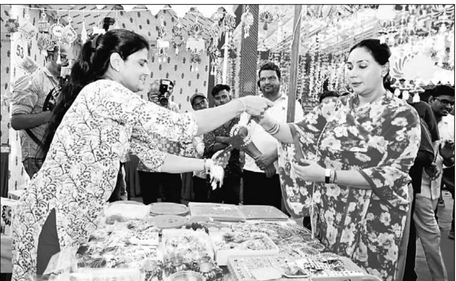
उपमुख्यमंत्री दिया कुमारी ने जवाहर कला केंद्र में आयोजित राज्य स्तरीय अमृता हाट में खरीदारी की।