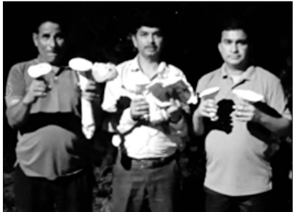
खाद्य दूध छाता मशरूम (केलोसाइबे इंडिका) की नई जंगली प्रजाति की खोज करने वाली टीम।

उदयपुर, (कास)। भारतीय कृषि अनुसंधान परिषद नई दिल्ली के मशरूम अनुसंधान निदेशालय चम्बाघाट के वडा सोलन (हिमाचल प्रदेश) के द्वारा संचालित अखिल भारतीय सर्वांगीण मशरूम अनुसंधान परियोजना, उदयपुर के वैज्ञानिकों ने राजस्थान के विभिन्न वन्य जीव अभ्यारण्यों एवं जंगलों में खाद्य एवं औषधीय मशरूम की विविधता का अध्ययन करने के लिए माह जुलाई-अगस्त में सघन निरीक्षण किया। निरीक्षण के दौरान अभी तक कुल 64 मशरूम प्रजातियों का संग्रहण किया है। निरीक्षण प्रमुख रूप से फुलवारी की नाल, फलासिया-कोटड़ा की नाल, सीतामाता वन्य जीव अभ्यारण्य-प्रतापगढ़, गोगुन्दा, सांडोल माता झण्डोलाव झल्लारा, सल्लुवर के जंगलों का किया गया। अखिल भारतीय समन्वित मशरूम अनुसंधान परियोजना