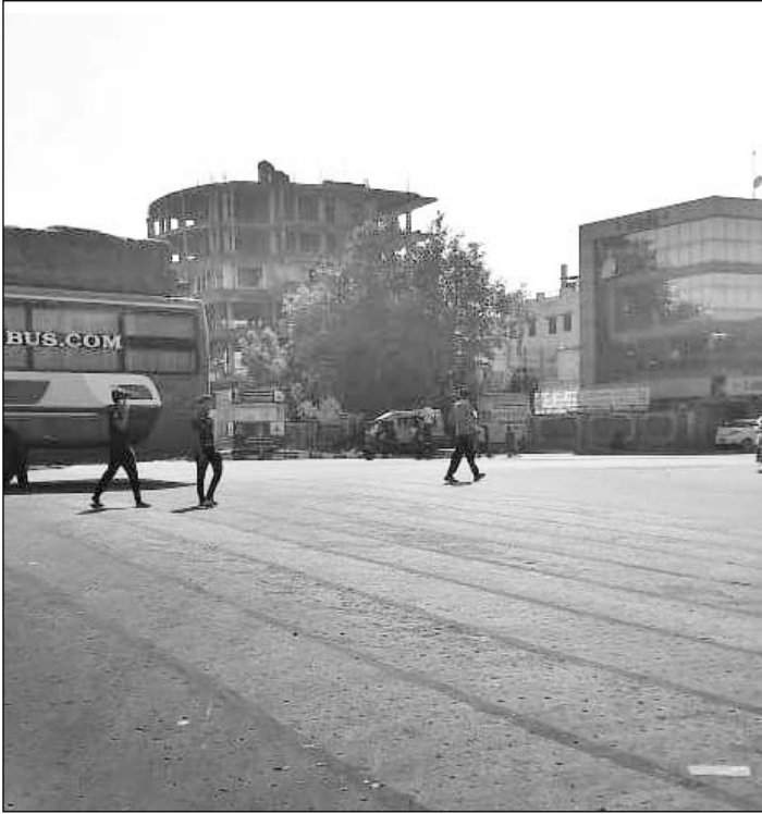
जवाहर लाल नेहरू मार्ग स्थित त्रिमूर्ति सर्किल पर की गई मैस्टिक डामर फ्लोरिंग में से स्टोन अभी से निकलकर बिखरने लगे हैं।

इतनी मजबूत होती है कि बरसात में भी नहीं उखड़ती। परंतु जयपुर विकास प्राधिकरण के दफ्तर से चंद कदम दूरी पर त्रिमूर्ति सर्किल और रामबाग चौराहे पर मैस्टिक डामर फ्लोरिंग का यह काम तय मानकों के मुताबिक नहीं हो रहा। ठेकेदार पैसे और समय बचाने के चक्कर में हल्का और घटिया काम कर रहा है, जिससे यहां सड़क दुर्घटनाओं का खतरा बन गया है। इस समय रामबाग सर्किल पर जोन-