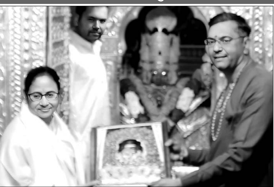
पुष्कर में ब्रह्मा मंदिर में दर्शन करने के बाद मंहत ने मुख्यमंत्री ममता बनर्जी को स्मृति चिन्ह भेंट किया।

अजमेर/पुष्कर/मदनगंज, (कासं)। पश्चिम बंगाल की मुख्यमंत्री ममता बनर्जी अपने एक दिवसीय दौरे पर मंगलवार सुबह अजमेर पहुंचीं। सीएम बनर्जी को कड़ी सुरक्षा के बीच उन्हें किशनगढ़ एयरपोर्ट से अजमेर लाया गया। बनर्जी ने सूफी संत ख्वाजा साहब की दरगाह में सूफी परंपरा के अनुरूप दरगाह जियारत कर अकौदत के फूल और मखमली चादर पेश कर देश में अमन, चैन और खुशहाली की दुआ मांगी। इसके बाद बनर्जी पुष्कर पहुंचीं, जहां उन्होंने पुष्कर सरोवर में पूजा अर्चना कर ब्रह्मा मंदिर में दर्शन किए। पश्चिम बंगाल की मुख्यमंत्री ममता बनर्जी ने अजमेर और राजस्थान की मीडिया से पूरी तरह से दूरी बनाए रखी और केवल पश्चिम बंगाल से आए मीडिया कर्मी से ही बातचीत की।