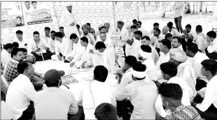
मालपुरा शहर के सरकारी डाक बंगले में कांग्रेस के बैनर तले धरना प्रदर्शन का आयोजन हुआ।

नियमानुसार केन्द्र व राज्य सरकार के मंत्रियों, सांसद व विधायक सहित प्रशासनिक अधिकारियों के ठहरने एवं ब्लॉक स्तरीय अधिकारियों से अल्प समय में चर्चा व मीटिंग के लिए डाक बंगलों का निर्माण करवाया गया था। इनकी मॉनिटरिंग का जिम्मा पीडब्ल्यूडी को सौंपा गया। किसी भी पार्टी के बैनर तले आयोजित होने वाले धरना प्रदर्शन व सभा का आयोजन पब्लिक पैलेस पर ही किये जाने की प्रशासन द्वारा स्वीकृतियां जारी किये जाने का प्रावधान है लेकिन सोमवार को कांग्रेसजनों ने नियम कायदों को ताक में रख प्रदेश में कांग्रेस की