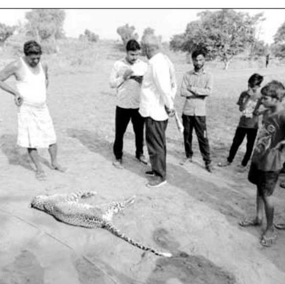
मृत पड़ा पैथर शावक एवं मौके पर उपस्थित ग्रामीण।

मासलपुर, (निसं)। मासलपुर के निकटवर्ती खनुपुरा गांव में बीती रात के बाद खेतों से गुजर रहे एक पैथर शावक की खेत में टूटे पड़े बिजली तार की चपेट में आने से मौके पर ही मौत हो गई। घटना का पता सोमवार प्रातः लगा जब ग्रामीण अपने खेतों की ओर गए। ग्रामीणों ने विद्युत निगम को सूचना देकर बिजली सप्लाई बंद कराई एवं पैथर के शावक की मौत की सूचना वन विभाग को दी। सूचना पाकर वन विभाग में खलबली सी मच गई।