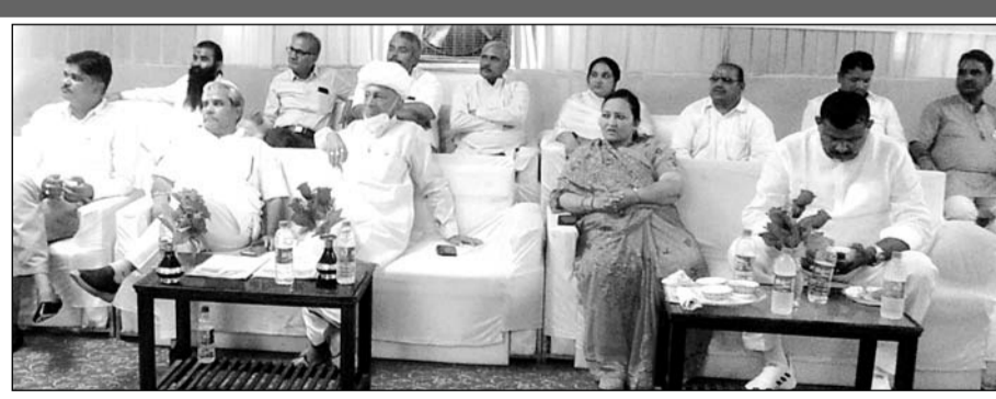
जालोर शहर के एक निजी होटल में वीडियो कॉन्फ्रेंसिंग के माध्यम से शिलान्यास कार्यक्रम का आयोजन किया गया। इस दौरान जनप्रतिनिधि व कई लोग मौजूद रहे।

जालोर शहर के एक निजी होटल में वीडियो कॉन्फ्रेंसिंग के माध्यम से शिलान्यास कार्यक्रम का आयोजन किया गया। कार्यक्रम में केन्द्रीय सड़क, परिवहन व राजमार्ग मंत्री नितिन गडकरी ने कहा कि केन्द्र सरकार ने राजस्थान में सड़कों का जाल बिछाने का कार्य किया गया है। सड़क मार्ग के रूप में राजस्थान अग्रणी है। जालोर में आरओबी बनने से लोगों को राहत मिलेगी। वहीं उन्होंने कहा कि यह तो अभी ट्रेलर है पूरी फिल्म तो अभी बाकी है। राजस्थान के लिए कई कार्यों की सौगात दी जायेगी। भाजपा सरकार राजस्थान में राजमार्ग बनाने के लिए कटिबद्ध है। सांसद देवजी पटेल ने भी वीसी के माध्यम से दिल्ली से सम्बंधित करते हुए कहा कि जालोर से आहोर जाने वाले मार्ग पर रेलवे क्रासिंग के चलते कई घंटे लोगों को इंतजार करना पड़ता था। जिसको लेकर मेरे द्वारा लगातार केन्द्र