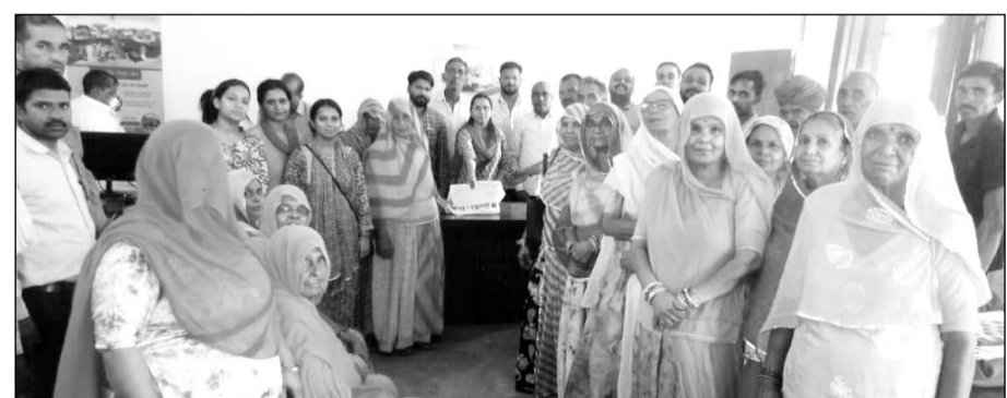
ग्राम पंचायत सकरा में आयोजित शिविर में लोगों को लाभान्वित किया।

श्रीमाधोपुर, (निर्स)। उपखंड क्षेत्र में कुल 14 स्थानों पर स्थाई महंगाई राहत एवं ग्राम पंचायत रामपुरा थोई व सकराय में प्रशासन गांवों के संग अभियान का आयोजन किया गया।