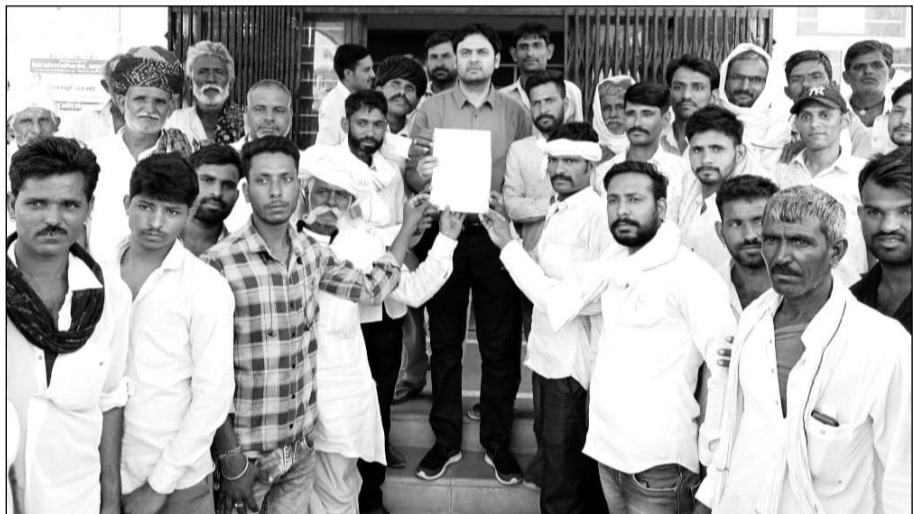
ग्रामीणों ने एसडीएम को ज्ञापन सौंपा।

सांभरझील, (निर्स)। ग्राम पंचायत बरडोटी के राजस्व ग्राम गोपालपुरा में चरागाह भूमि पर कथित अतिक्रमण को हटाने की मांग को लेकर ग्रामीणों ने मंगलवार को एसडीएम को शिकायत दर्ज करवाई तथा उचित कार्रवाई के लिए लिखित शिकायत पत्र भी सौंपा।