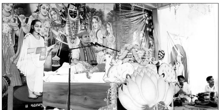
अटल उद्यान में चल रही भागवत कथा के पांचवें दिन भगवान श्री कृष्ण की लीलाओं का वर्णन किया।

इस दौरान महाराज ने कहा कि भागवत कथा का श्रवण करने वालों का सदैव कल्याण होता है और मुक्ति मिलती है। उन्होंने ने कहा कि मनुष्य जीवन विषय वस्तुओं को भोगने के लिए नहीं बना है लेकिन आज का मानव भगवान की भक्ति छोड़कर विषय वस्तुओं को भोगने में भी लगा हुआ है। उन्होंने कहा की भागवत कथा विचार, वैराग्य, ज्ञान और हरि से मिलने का मार्ग बता देती है। कलयुग की महिमा का वर्णन करते हुए कहा कि कलयुग में