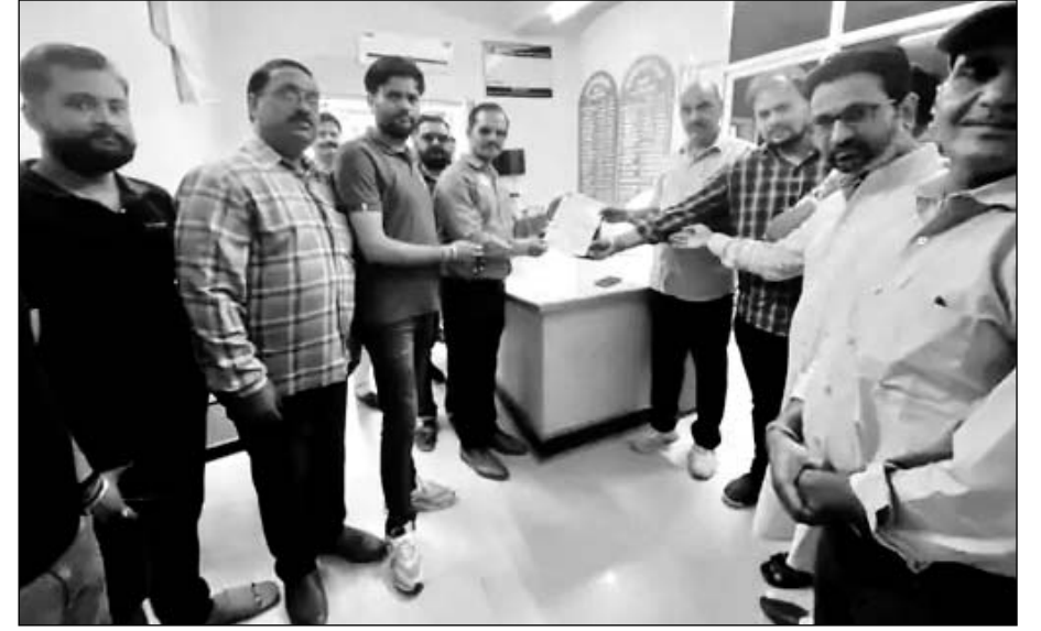
श्री राजपूत करणी सेना गंगापुर सिटी व राजपूत समाज ने जिला कलेक्टर के पीए को ज्ञापन दिया।

श्री राजपूत करणी सेना गंगापुर सिटी व राजपूत समाज ने जिला कलेक्टर कार्यालय में ज्ञापन दिया