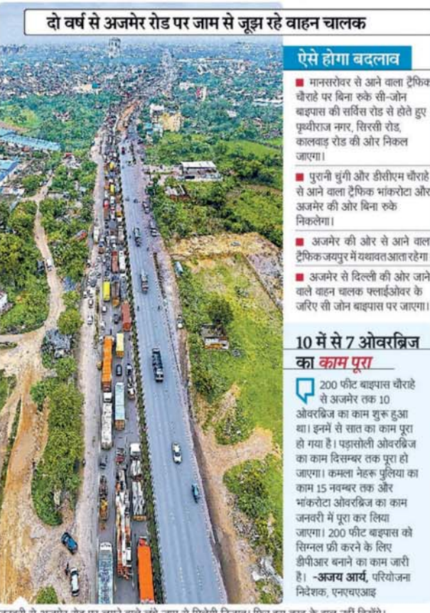
दो वर्ष से अजमेर रोड़ पर जाम से जूझ रहे वाहन चालक

दो फ्लाईओवर, दो अंडरपास बनेंगे शहर के व्यस्त बौराहों में से एक 200 फीट बाइपास सिग्नल फ्री होगा। इससे लाखों वाहन चालकों की राह सुगम होगी। डिक्लेरिंग टोल फ्री बनाने का काम चल रहा है। इस प्रोजेक्ट पर एनएचआई करीब 300 करोड़ रुपए खर्च करेंगे। 200 फीट बाइपास बौराहों पर दो फ्लाईओवर और दो अंडरपास बनाए जाएंगे।