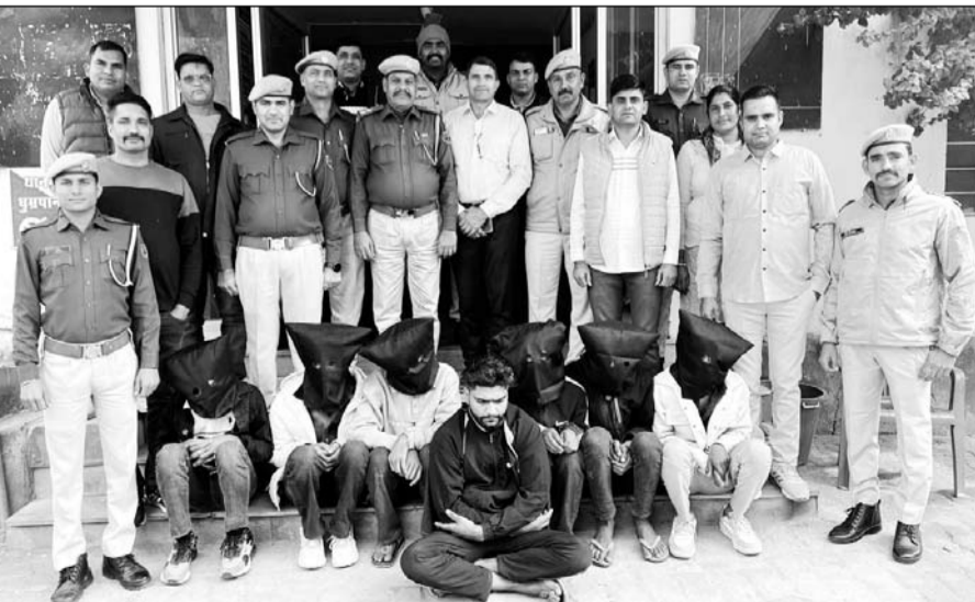
पुलिस ने बुजुर्ग का अपहरण करने वाले सात आरोपियों को गिरफ्तार कर छह को बापर्दा रखा।