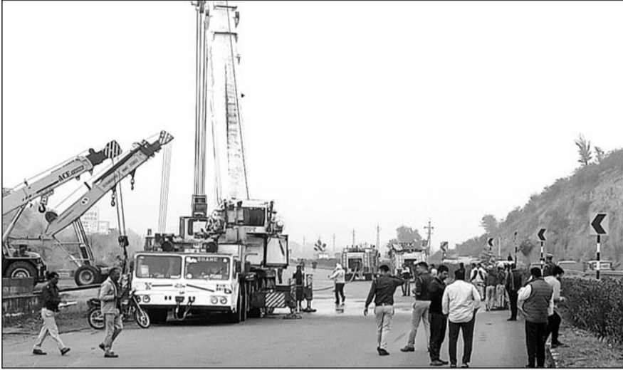
टैंकर पर पानी डालते हुए टैंकर को हाइड्रो क्रेन से सीधा किया गया।