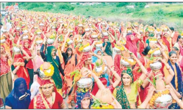
निवाई के गांव किवाडा में पांच दिवसीय आध्यात्मिक महोत्सव और यज्ञ को लेकर कलश यात्रा निकाली गई।