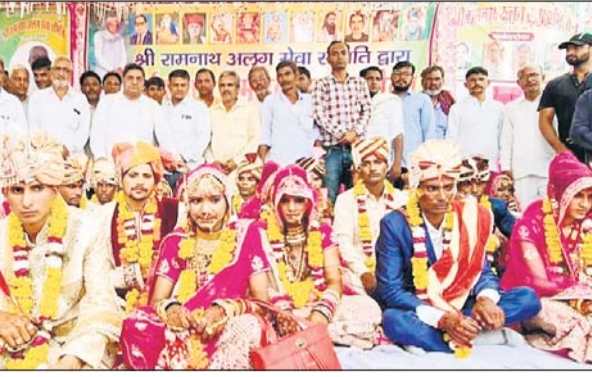
ग्राम टसकोला में तृतीय सर्व समाज सामूहिक विवाह सम्मेलन आयोजित हुआ।