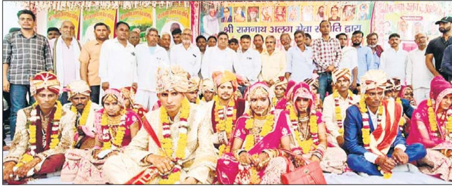
ग्राम टसकोला में तृतीय सर्व समाज सामूहिक विवाह सम्मेलन आयोजित हुआ।

उन्होंने वकीलों से टोल वसूलने को लेकर चर्चा की एवं कहा कि टोल