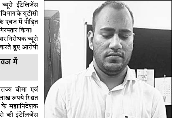
राज्य बीमा प्रवधायी विभाग में कार्यरत आरोपी वरिष्ठ सहायक गिरफ्तार किया।

■ डेथ क्लेम पास करने के एवज में पीड़ित से रिश्वत मांगी थी