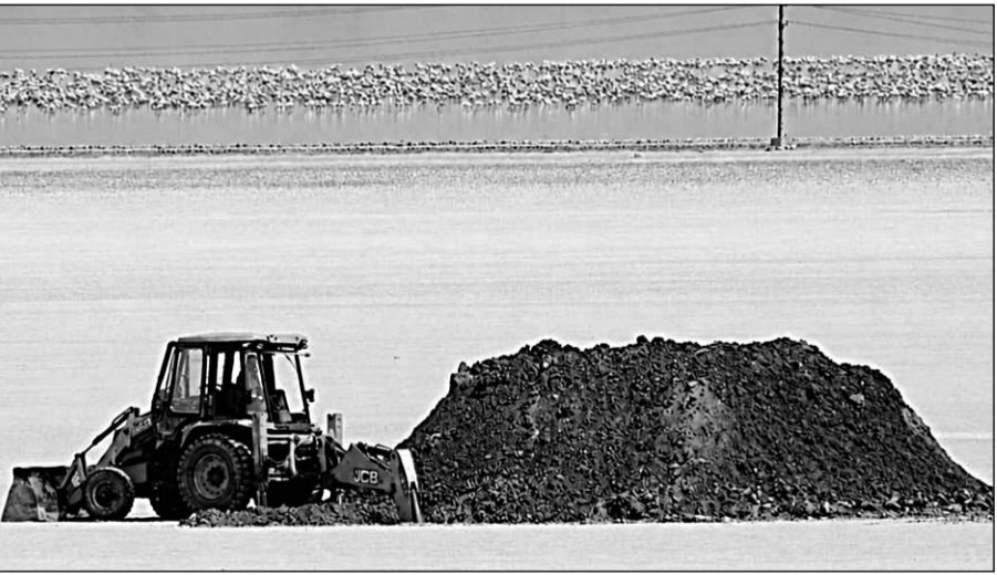
सांभर साल्ट्स लिमिटेड अपने फायदे के लिए कुछ मीटर की दूरी पर ही जेसीबी से खुदाई करवाकर वाटर स्टोरेज के लिए एक बृहद तालाबनुमा गड्ढा तैयार किया जा रहा है।

सांभरझील, (निर्सं)। रामसर साइट में दर्ज विश्व नम भूमि का दर्जा प्राप्त लवणीय झील में वर्तमान में हजारों की तादाद में प्लेमिंगो पक्षियों का इस भीषण गर्मी में भी जमावड़ा इस बात का स्पष्ट सबूत है कि इन परिदों को यहां का वातावरण माफिक आ गया है। शीतकालीन सत्र में हजारों किलोमीटर की यात्रा कर यहां आकर यह अपने