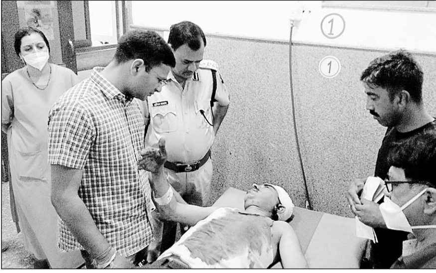
जोधपुर के मथुरादास माथुर अस्पताल में जिला कलेक्टर व एसपी ने घायलों की कुशलक्षेम पूछी।