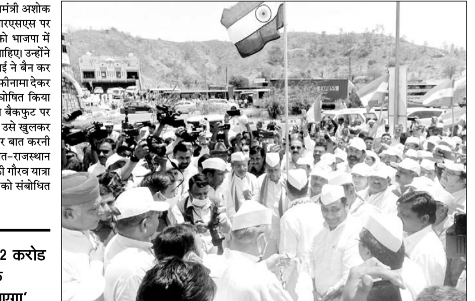
रतनपुर बॉर्डर पर आजादी की गौरव यात्रा व डांडी यात्रा का स्वागत किया, इस दौरान कई कांग्रेस नेता व कार्यकर्ता मौजूद रहे।

डुंगरपुर, (निस)। राजस्थान के मुख्यमंत्री अशोक गहलोत ने राष्ट्रीय स्वयंसेवक संघ आरएसएस पर वार करते हुए कहा कि आरएसएस को भाजपा में मर्ज कर स्पष्ट राजनीति में उतर जाना चाहिए। उन्होंने कहा कि भाजपा को सरदार वल्लभभाई ने बैन कर दिया था जिसके बाद आरएसएस ने माफिनामा देकर आरएसएस को सांस्कृतिक संगठन घोषित किया था। मुख्यमंत्री ने कहा कि आरएसएस बैकफुट पर रहकर भाजपा के लिए काम करता है। उसे खुलकर राजनीति में आना चाहिए और मुद्दों पर बात करनी चाहिए। शुक्रवार को डुंगरपुर में गुजरात-राजस्थान की सीमा रतनपुर बॉर्डर पर आजादी की गौरव यात्रा डांडी यात्रा के स्वागत के दौरान सभा को संबोधित करते गहलोत ने यह बात कही।