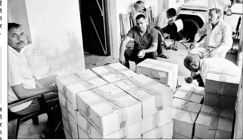
बयाना में जयपुर से आई आबकारी विभाग की स्पेशल टीम ने गेस्ट हाउस से अंग्रेजी-देशी शराब जब्त की।

कार्रवाई के समय अवैध शराब के कारोबार में लिप्त शराब माफिया मौके का लाभ उठाकर भागने में सफल रहे। यह गेस्ट हाउस पुलिस चौकी व आबकारी थाने से मात्र तीस कदम की दूरी पर है। इस कार्रवाई को लेकर और सामने बैठे संबंधित विभाग के अधिकारी- कर्मचारियों की कार्यशैली को लेकर लोगो में तरह-तरह की चर्चाएं रहें। यह शराब इस टीम ने बजरिया मार्केट स्थित गेस्ट हाउस पर उसके बगल में स्थित दो अन्य बिल्डिंग से बरामद की। कार्रवाई के समय अवैध शराब के कारोबार में लिप्त शराब माफिया मौके का लाभ उठाकर भागने में सफल रहे। आबकारी विभाग की इस छापामार