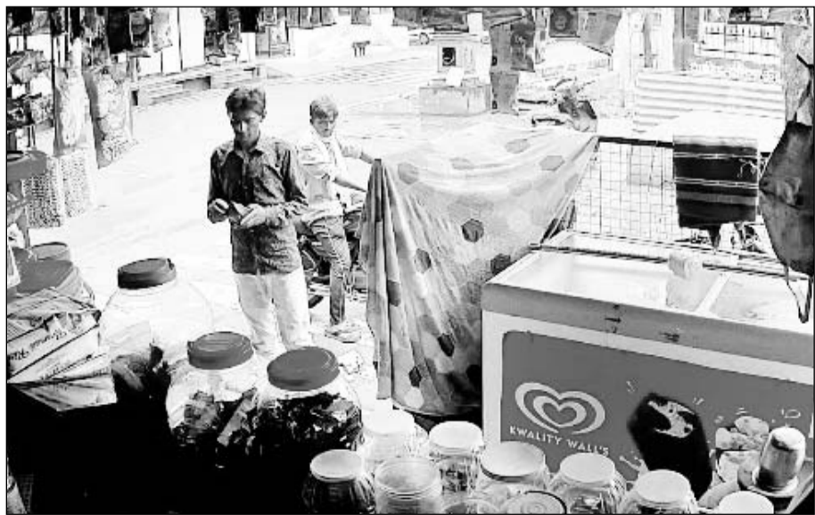
आरोपी पूर्व में भी चोरी की वारदात को दे चुके हैं अंजाम।

भीलवाड़ा, (निसं)। शहर के प्रताप नगर थाना क्षेत्र में दिनदहाड़े चोरों ने परचूनी दुकान से तेल टीन चोरी की वारदात को अंजाम दिया है। दुकान पर लगे सीसीटीवी कैमरे में कैद हुई इस पूरी वारदात के बाद पुलिस आरोपियों की तलाश कर रही है।