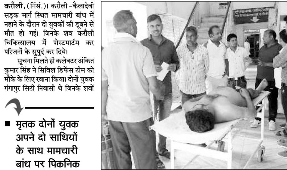
करौली अस्पताल में परिजनों ने पोस्टमार्टम कराया।

सूचना मिलते ही कलेक्टर ने सिविल डिफेंस टीम को मौके के लिए रवाना किया