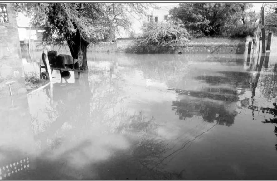
सुजानगढ़ शहर के प्रगति नगर में जमा बरसाती पानी।

इसी प्रकार शहर के नलिया बास, वाल्मिकी बस्ती, ईदगाह मस्जिद, नया बाजार, नया बास, गांधी चौक, दो नम्बर रेलवे फाटक, लाडनू बस स्टैंड, सम्राट होटल के पास सहित शहर के अनेकों इलाकों में बरसाती पानी जमा हो गया।